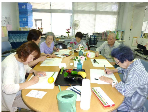
みんなで絵手紙に夢中！

くるみの事務所を活用して、毎月第4土曜日の1時から開催しています（お茶代200円）。参加人数はまだまだ少ないですが、チラシやタウンニュースを見て足を運んでくださる方もいらっしゃいました。ひとり暮らしの方や、中には震災後にこちらに来られた方で知り合いが中々出来ないと参加されました。