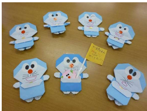
いろいろな表情のドラえもん

今後は内外からメンバーを募集し、居場所チームを充実させ、皆さんとともに運営できればと思っています。地域の方々と一緒に活動しながら、誰でも気軽に立ち寄れる場所を提供していきたいと思っています。