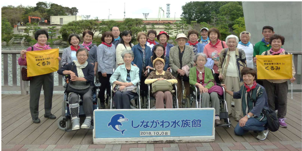
しながわ水族館入口で