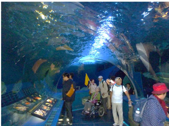
トンネル状の水槽